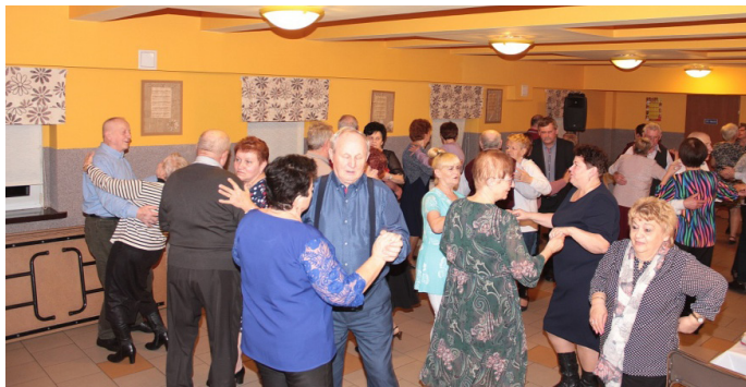
Zabawa z przytupem

Karnawał 2023 zamknęliśmy 21 lutego tradycyjną zabawą ostatekową, w której brało udział 40 osób. W trwającej do północy zabawie oprawę muzyczną, podobnie jak na zabawie Andrzejkowej, sylwestrowej i na „babskim combrze” zapewnił niezawodny DJ Jan Burek, zarazem autor wszystkich zdjęć z naszych imprez.