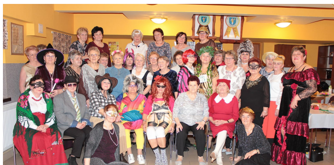
Grono dostojnych uczestniczek Babskiego Combra.

Najważniejszą imprezą karnawałową długo oczekiwaną był tradycyjny Babski Comber w dniu 8 lutego, w którym uczestniczyło około 45 naszych Pań. W wymyślnych i pięknych kreacjach bawiły się one przednio, przy skocznej muzyce tanecznej, którą serwował nasz DJ Jan Burek.